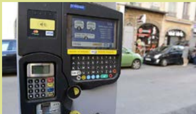
PARCMETRES & PARKINGS

La plateforme À Proximité offre la possibilité de s'interconnecter avec vos partenaires publics ou privés, d'intégrer des services municipaux, générer des jeux et animations ou encore de piloter des campagnes collectives de dons.