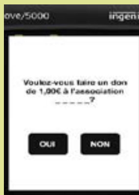
CAMPAGNES DE DONS